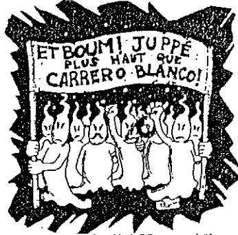
Carrero Blanco : dauphin de F. Franco expédié au skième étage par une bombe de l'EIA.